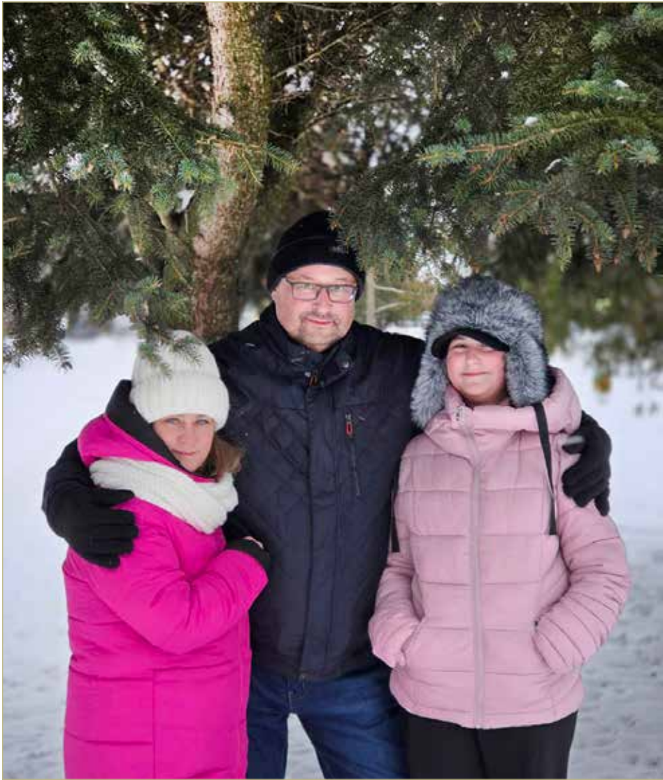
Семья Музеник выбрала Великий Новгород неслучайно.

— У меня — шок. Как это так? Я подошла к учительнице: «Вы же не говорили,