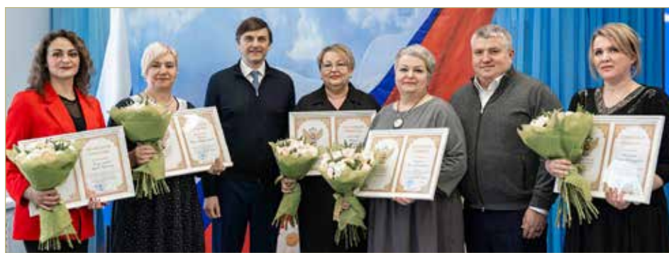
Глава Минпросвещения поблагодарил педагогов Ермолинской школы и детского сада за их труд и любовь к детям и вручил им ведомственные награды.