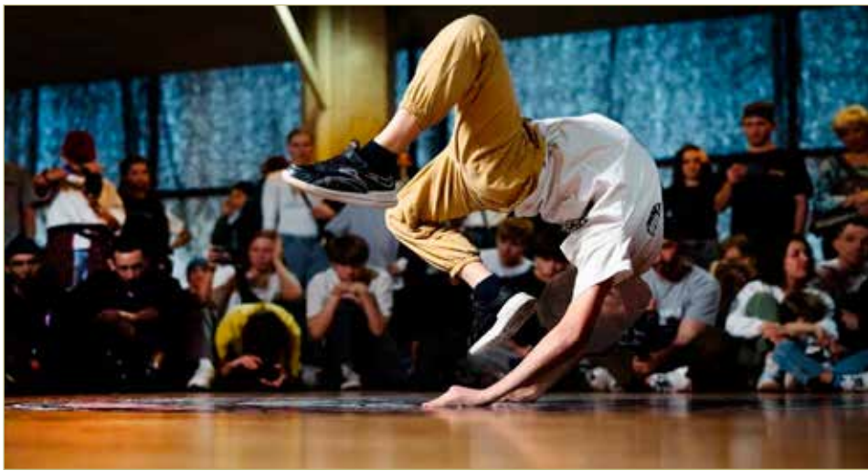
Эффектно, спортивно, круто — говорить о брейкинге можно много. Но танцоры советуют просто попробовать.

Сегодня центр «R3» регулярно посещают 170 человек: абсолютное большинство — мальчишки-подростки, но есть и девчонки. А ещё десяток родителей — папы/мамы, увлечённые брейкигом вслед за детьми. Человек 60 стоят в