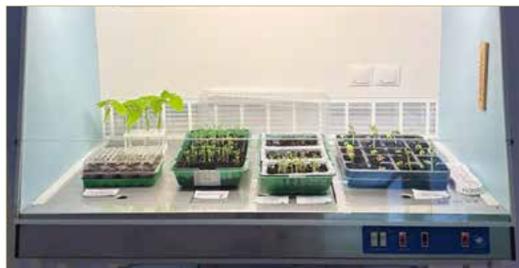
С таким оборудованием можно себя почувствовать фермером прямо на уроке.