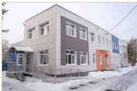
Детский сад в Ермолине был капитально отремонтирован в 2025 году по нацпроекту «Семья».

Инфраструктура школы будет включать академический городок с пространствами для занятий точными и общественными науками, творчеством и проектной деятельностью. Она будет состоять из нескольких корпусов, где разместят административные зоны, учебные блоки с рабочими кабинетами