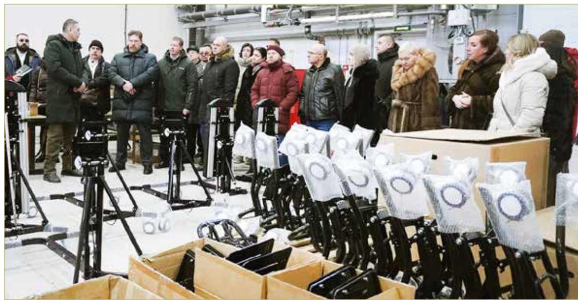
Сейчас на производстве ООО «Актив» изготавливают четыре вида изделий.

НОВГОРОДСКИЕ ПРОИЗВОДИТЕЛИ РАССКАЗАЛИ О РАБОТЕ НА ПЛОЩАДКЕ ТЕХНОПАРКА «ТРАНСВИТ»