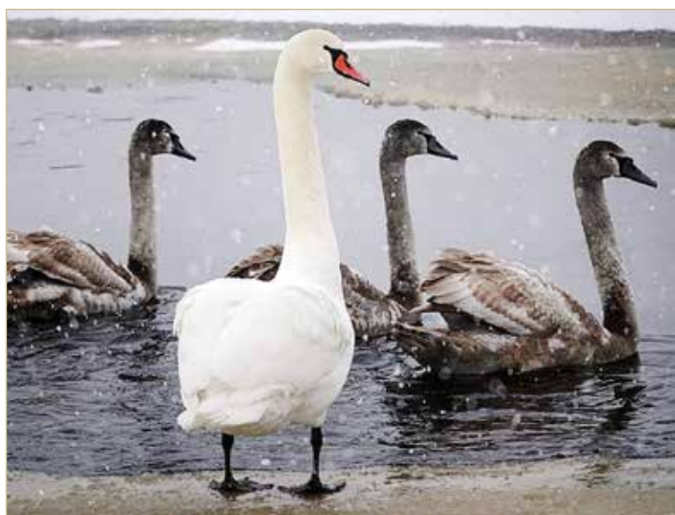
От соседства людей и лебедей проигравших этой зимой нет.

Сейчас спектакль живёт в Доме народного творчества, в замечательной, полностью подходящей духу «Деревяшек» традиционной атмосфере. Но шатёр-лес, где разворачивается сказочное действие, — мобильная конструкция, которая может поместиться практически на любой территории. Поэтому команда «Деревяшек» не исключает возможность попутешествовать по разным городским локациям. И хотя история получилась универсальная, команда проекта уверена: там, где будут играть «Деревяшки», обязательно появится частичка новгородского духа.