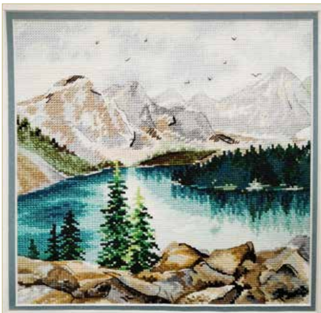
Пейзаж с озером Морейн в Канаде — один из хитов компании «Овен».

Так, день за днём «Овен» перешагнул в свой 26-й год. Что дальше? Одно знаем точно — без новых красивых пейзажей компания не оставит российских мастериц. И китайских, видимо, тоже.