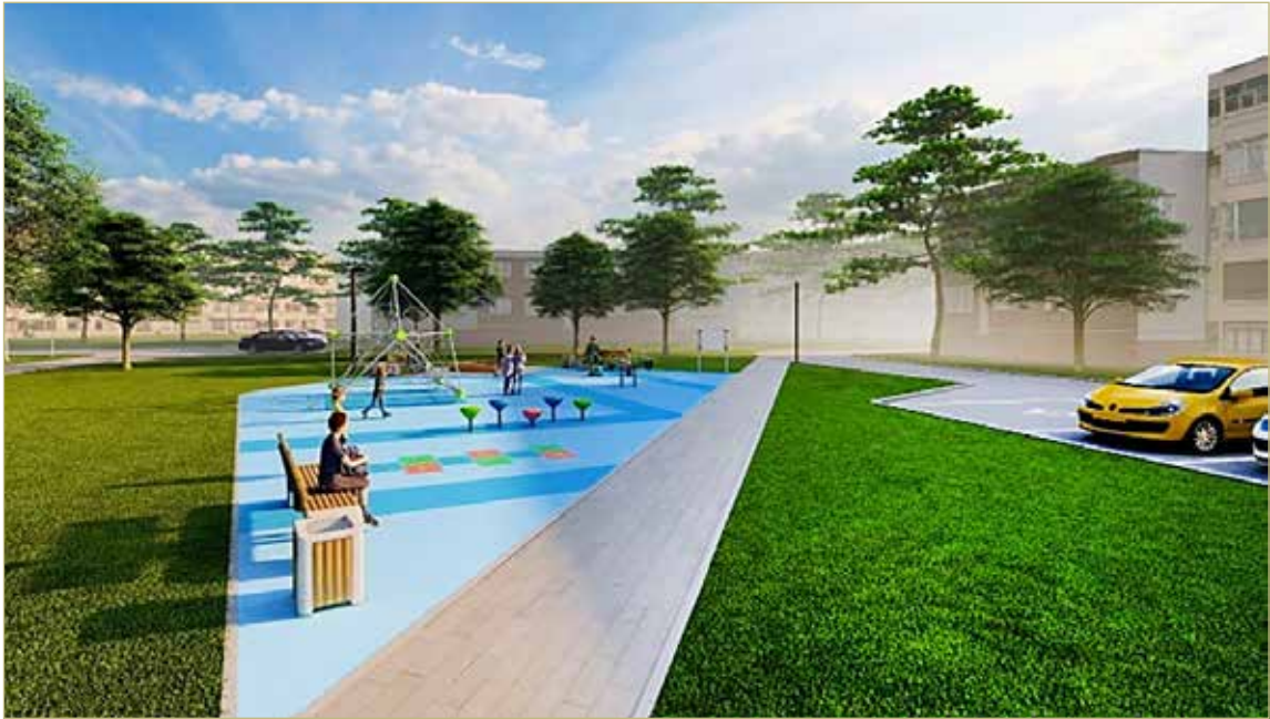
Так выглядит план, который валдайцы хотят сделать реальностью.

Валдайцам предложили два варианта дизайн-проекта благоустройства, и победу ожидаемо одержала версия, которая предполагает более разнообразное наполнение для этого уголка города. На территории установят детскую площадку с игровыми элемен-