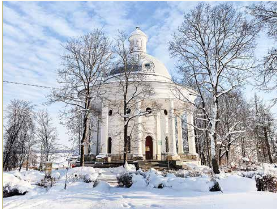
Строительство путевой дворцовой ротонды было начато в 1786 году по заказу Екатерины II.

Совершенная новинка — электронный звонарь. Набор колоколов — подарок друзей музея из города Тутаева, что на Ярославщине. Там живут и творят мастера литья. Примечательно, что