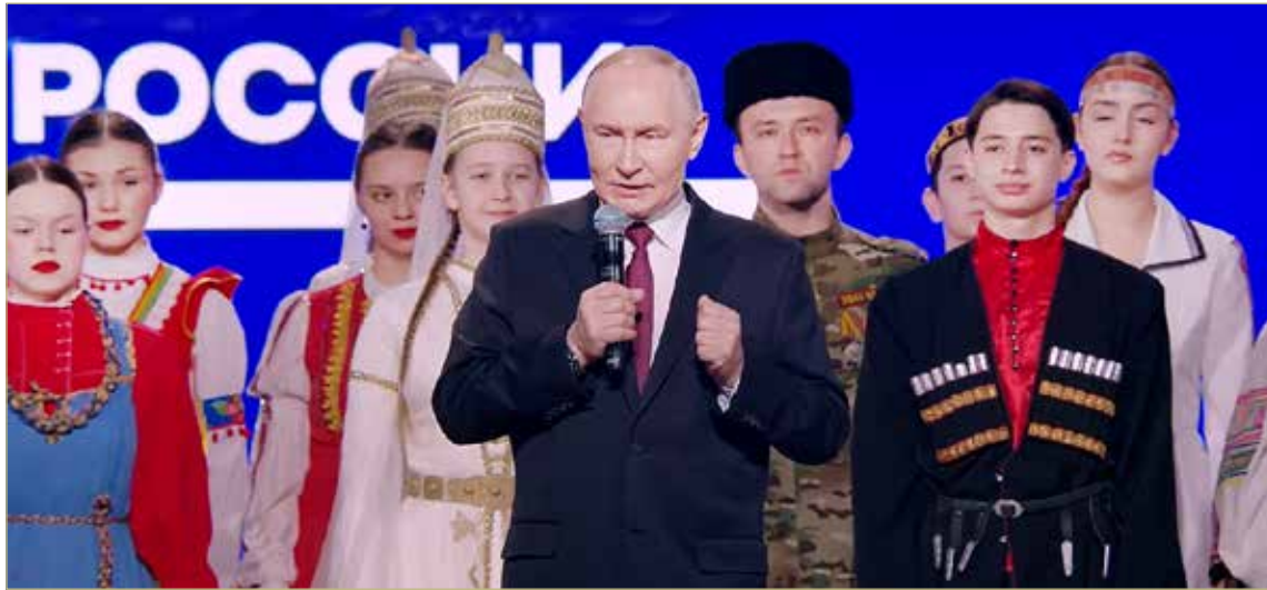
Владимир Путин принял участие в церемонии открытия Года единства народов России.

На главной сцене марафона общества «Знание» «Россия — се-