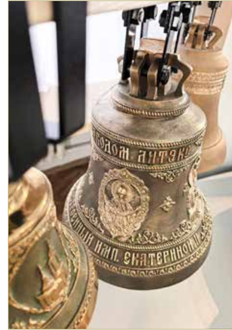
Подарок музею из Москвы.

И «вознесоша его на колокольную на площади с прочими колоколами звонити», — сообщает нам Софийская I летопись о судьбе новгородского вечевых колокола, увезённого в 1478 году в Москву. Может, и не надо было тут об этом вспоминать, но ведь — февраль. Во всём виноват февраль.