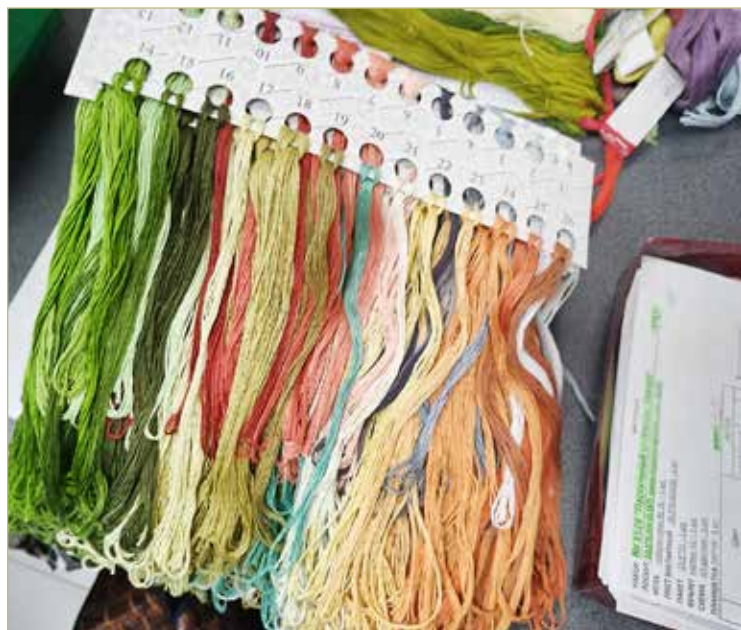
В распоряжении дизайнеров предприятия сотни оттенков мулине.