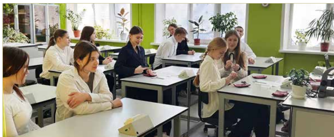
В агроклассе занимаются ученики 7-го, 10-го и 11-го классов.